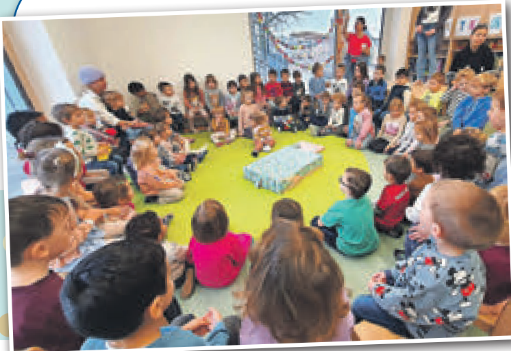
Die Kindergartenkinder beim gespannten Auspacken des Geschenks, das der Bürgermeister im Namen der Gemeinde mitgebracht hatte.

Die Kinder begrüßten die Gäste mit einem fröhlichen Lied und erhielten Geschenke, die auch die „Schulgeister“ mitgebracht hatten. Die Bürgermeister und Pater Mato besichtigten die liebevoll eingerichteten und farbenfrohen Gruppenräume.